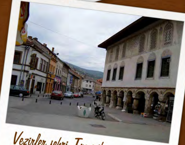
Vezirler şehri Travnik...