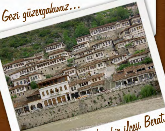
Arnavutluk'un bir ilçesi Berat...