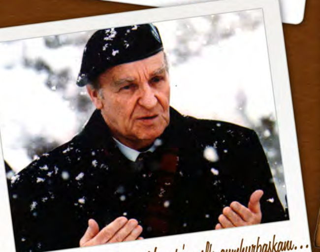
Alija İzetbegović - Bosna Hersek'in ilk cumhurbaşkanı...